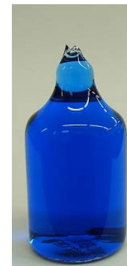
サンプル吸引後のAVバイアル(一例)